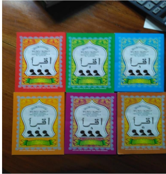
Gambar 2. Iqro' Jilid 1-6 Team Tadarus "AMM" Yogyakarta