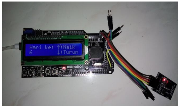
Gambar 3. Penentuan hari mulai penanaman