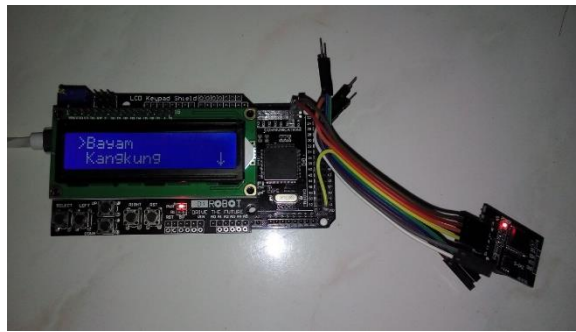
Gambar 2. Pemilihan jenis tanaman dengan LCD Keypad