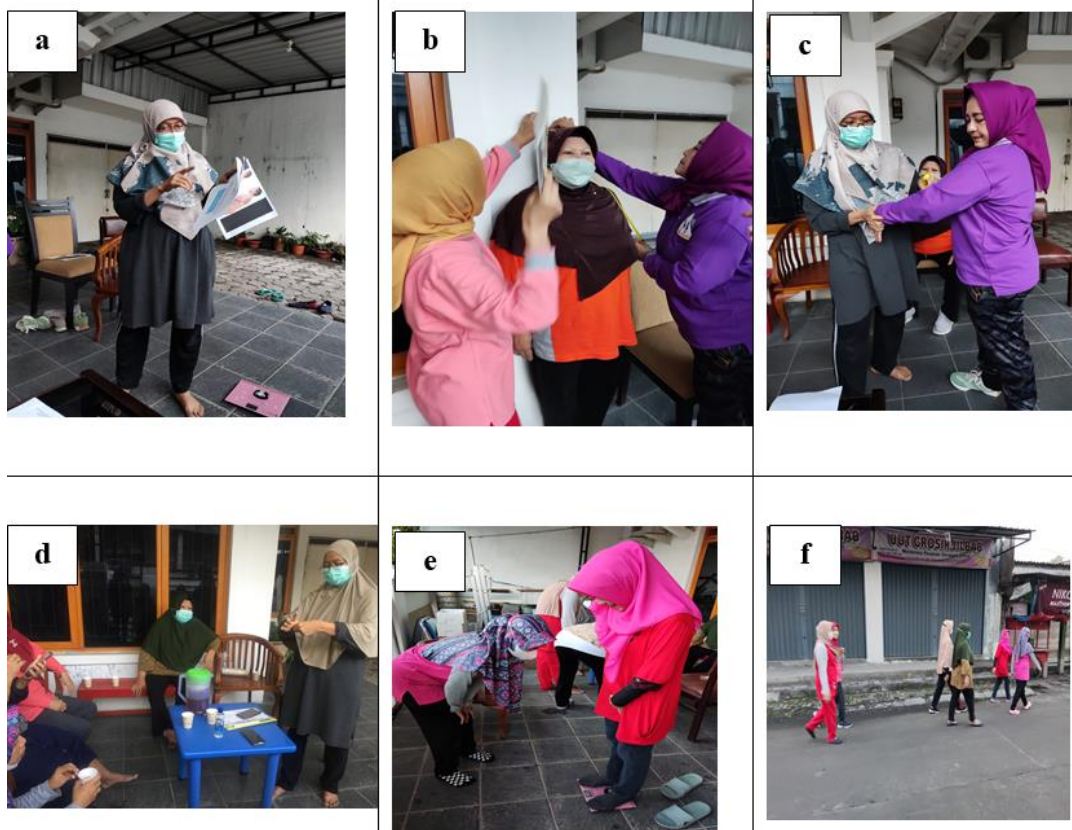
Gambar 2. a. Penyuluhan kesehatan, b. Pengukuran tinggi badan, c. pengukuran lingkaran lengan atas, d. Penyuluhan kesehatan, e. Pengukuran berat badan, f. Kegiatan jalan sehat

Prosentase kehadiran kelompok lansia dan pra lansia meningkat dari bulan Juni-September. Rata-rata prosentase peningkatan sebanyak 9%.