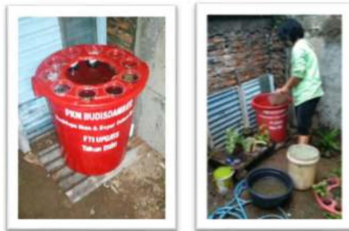
Gambar 2. Lahan Sempit Warga yang Bisa Dimanfaatkan

Ketahanan pangan di masa pandemi Covid-19 seperti sekarang ini menjadi sesuatu yang harus diupayakan untuk menghindari krisis pangan yang belum tahu kapan berakhir, kondisi ini sangat terasa dilingkungan masyarakat khususnya bagi warga yang terdampak (Hanifah & Ningsih, 2020). Himbauan dari pemerintah kepada masyarakat, supaya masyarakat ikut andil dalam menjaga ketahanan pangan untuk menghindari krisis pangan (Febri et al., 2019). Masyarakat diharapkan menjadi lebih kreatif dan bisa berkreasi untuk mengakali situasi yang ada (Masitoh et al., 2020). Termasuk halnya dalam menjaga akses terhadap pangan. Masyarakat diharapkan memiliki kesadaran untuk melakukan penanaman mandiri minimal untuk memenuhi kebutuhan pangan sendiri (Perwitasari et al., 2019). Ada banyak sekali cara untuk melakukan penanaman mandiri seperti misalnya urban farming dan juga melakukan penanaman dengan metode aquaponik dengan memanfaatkan lahan-lahan yang ada di rumah (Hanifah & Ningsih, 2020). Dalam rangka untuk menjaga ketersediaan pemenuhan kebutuhan pangan keluarga secara mandiri (Setiyaningsih et al., 2020), maka perlu diadakan kegiatan pendampingan di wilayah RT.08 RW.X Kelurahan Kembangarum Kecamatan Semarang Barat Kota Semarang. Gambar 2 memperlihatkan lahan sempit warga yang dapat dimanfaatkan sebagai lahan ketahanan pangan keluarga.