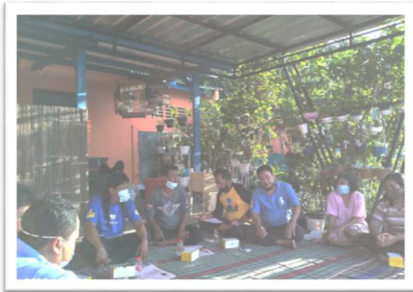
Gambar 5. Sosialisasi tentang ketahanan pangan

yang luas dan modal yang besar. Dalam hal ini bisa dilakukan didalam satu wadah yaitu ember, inilah yang menjadi daya tarik warga dalam menciptakan ketahanan pangan. Terlihat pada Gambar 3 tim pengabdian sedang memberikan penyuluhan dan edukasi kepada warga yang hadir tentang ketahanan pangan.