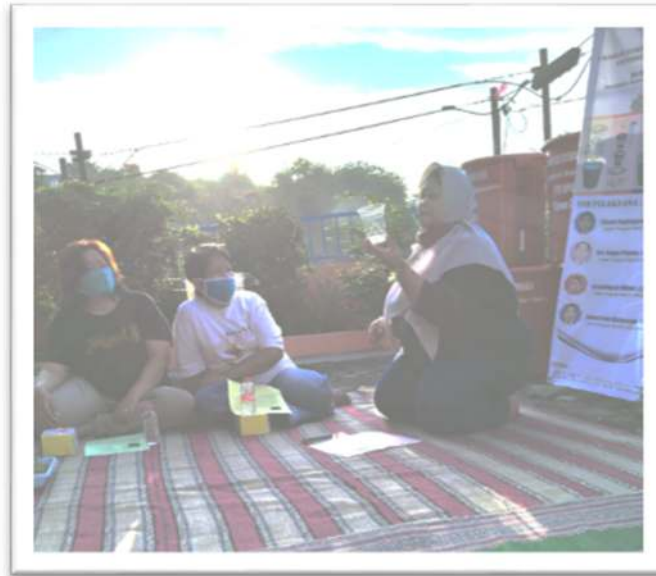
Gambar 6. Sosialisasi tentang Sistem Budisdamber

Langkah terakhir dalam kegiatan ini adalah evaluasi. Evaluasi ini dilakukan untuk memperbaiki setiap kekurangan yang ditemukan selama pengabdian dilaksanakan. Setiap kegiatan dievaluasi dan perbaikan dilakukan berdasarkan hasil evaluasi tersebut. Setelah kegiatan selesai, kemudian diadakan evaluasi dan refleksi hasil kerja penyuluhan. Seberapa besar penguasaan peserta terhadap materi dapat dilihat dari hasil pengetahuan. Keberhasilan kegiatan ini dilihat dari indikator keberhasilan peningkatan pengetahuan, yaitu: (1) Pengetahuan peserta mitra terkait dengan bagaimana usaha dalam menciptakan ketahanan pangan di rumah, dapat dilihat dari nilai tes sebelum dan sesudah ceramah/penyuluhan. (2) Pengetahuan peserta mitra terkait dengan sistem Budisdamber sehingga dapat diimplementasikan dalam aktivitas atau kegiatan sehari-hari.