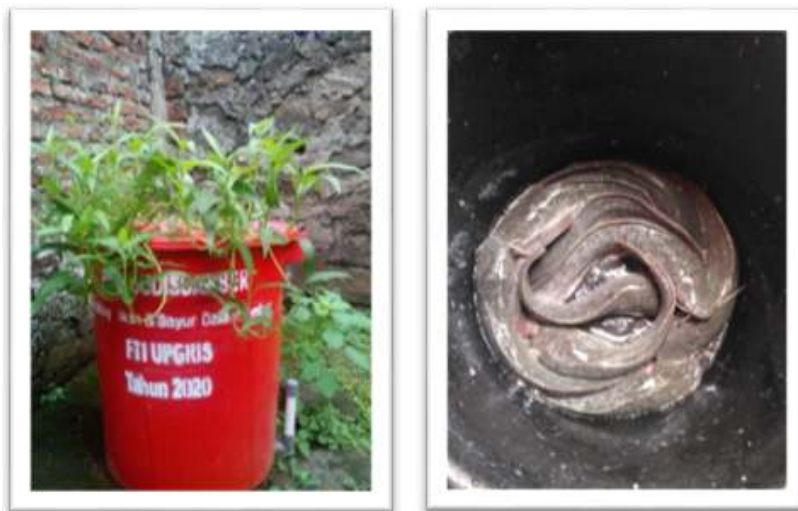
Gambar 7. Hasil Panen

kangkung tinggal dipotong. Hasil panen selain dikonsumsi sendiri, dibagi-bagikan ke tetangga sekitar dan dijual jika berlebih. Secara analisis usaha keuntungan ekonomi dari hasil penjualan ikan dan sayur dari budikdamber relatif kecil, lazimnya hasil budikdamber untuk memenuhi kebutuhan pangan keluarga. Jika ingin berpotensi sebagai penghasilan sampingan bisa, tergantung dari jumlah dan volume ember yang dimiliki karena berhubungan dengan kapasitas produksi yang dihasilkan. Secara hasil panen yang berkelanjutan dari hasil produksi ikan dan sayur secara ekonomi menguntungkan jika dibandingkan dengan pembelian langsung dipasar.