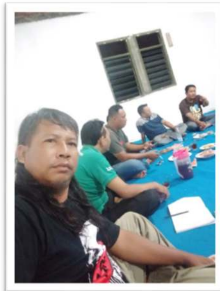
Gambar 4. Sosialisasi Kepada Warga

Langkah pertama adalah sosialisasi program yang memiliki tujuan untuk memberikan gambaran tentang program yang akan dilaksanakan. Selain itu juga untuk memberikan motivasi dan stimulus ke warga demi terlaksananya program ini. Target peserta adalah bapak-bapak dan ibu-ibu PKK di RT 08 RW X di Kelurahan Kembangarum, Kecamatan Semarang Timur. Gambar 2 memperlihatkan kegiatan sosialisasi program kepada warga. Sosialisasi dilakukan pada saat kegiatan rutin arisan bapak-bapak dan kegiatan PKK.