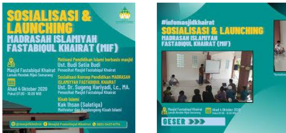
Gambar 3 dan 4. Sosialisasi dan Launching Madrasah Islamiyyah Fastabiqul Khairat Lemah Mendak Mijen Semarang