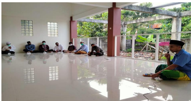
Gambar 2. Sosialisasi program TPQ-PK bersamaan peresmian masjid fastabiqul Khairat Lemah Mendak, 5 September 2021

Setelah bersilaturahmi dengan sejumlah tokoh di daerah Lemah Mendak, termasuk ketua RT dan RW serta takmir masjid Nurul Falah dan Mushala perumahan Nirwana, tim pengabdian dan mitra sepakat untuk mengundang para tokoh masyarakat dan keluarga pewakaf masjid Fastabiqul Khairat dengan skala terbatas untuk mensosialisasikan program masjid yang baru terbangun ini, khususnya program TPQ-PK. Acara dilaksanakan pada tanggal 5 September 2021 dihadiri beberapa warga Lemah Mendak dan pengurus masjid Nur Falah dan Mushala Perumahan Nirwana serta jajaran RT dan RW setempat.