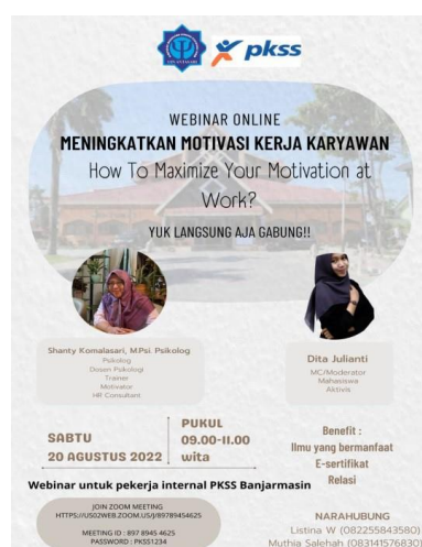
Gambar 1. Pamflet Webinar

Sebelum acara ini dilaksanakan, kelompok magang (PKP) UIN Antasari Banjarmasin menyiapkan flyer Webinar online, sertifikat untuk pemateri, mc, panitia, dan peserta Webinar, menyiapkan materi yang disesuaikan dengan kebutuhan pekerja outsourcing terkait motivasi kerja, serta rundown acara untuk kelancaran acara dengan terurut secara sistematis, setelah selesai lalu membagikan flyer Webinar dengan memanfaatkan media Whatsapp dan bantuan supervisor lapangan dan RO di PT PKS Banjarmasin untuk membagikan flyer kepada pekerja outsourcing. Terhitung mulai dari tanggal 18 Agustus 2022 sebagai persiapan pengumpulan peserta Webinar.