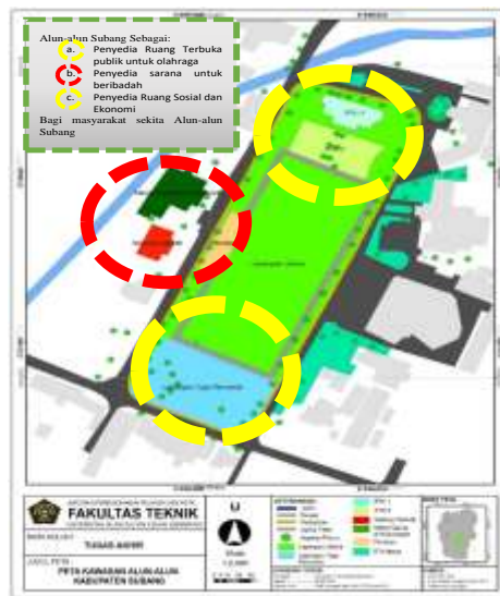
Gambar 3. Hubungan kawasan dengan sekitar

merupakan ruang yang sangat luas, unik dan nyaman yang dapat digunakan masyarakat untuk berbagai kegiatan seperti ibadah, olahraga, dan perjalanan. Juga, jika tindakan ini positif dan bermanfaat, masyarakat sekitar dapat saling berkomunikasi dan terlibat dalam berbagai kegiatan. Untuk menganalisis hubungan antara Alun-alun Subang dan sekitarnya,