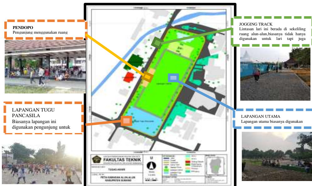
Gambar 5. Kemampuan Alun-alun dalam menarik pengunjung

Ruang Alun-alun yang didesain untuk menampung banyak pengunjung dilengkapi dengan beberapa setting grup yang bisa dimanfaatkan untuk duduk, ngobrol, menikmati jajan dan mengerjakan tugas. Pada waktu-waktu tertentu juga dimanfaatkan untuk acara atau even tahunan yang memang diadakan untuk umum dan tidak dipungut biaya. beberapa pengunjung terlihat memanfaatkan ruang Alun-alun untuk melakukan berbagai aktivitas seperti lapang tugu pancasila sering dijadikan untuk senam, lalu pendopo yang digunakan untuk latihan taekwondo dan beberapa ruang lainnya yang menunjang dan dimanfaatkan dengan baik oleh pengunjung.