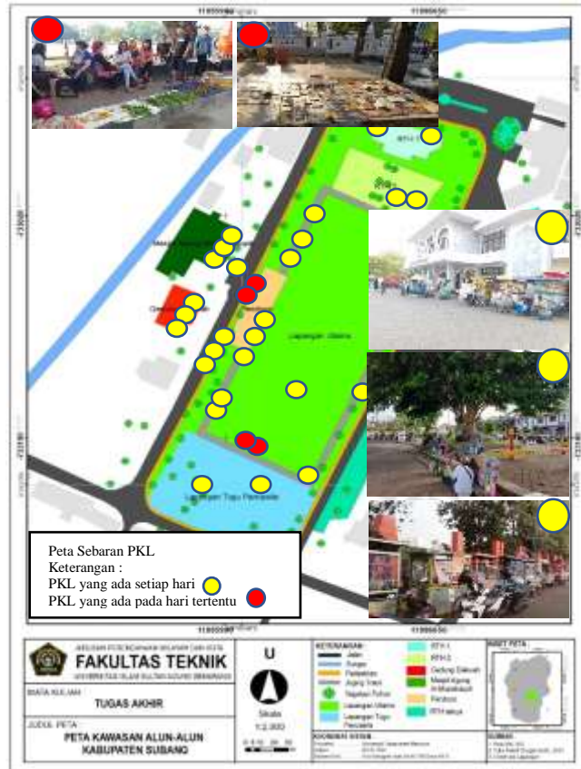
Gambar 6. Sebaran PKL di Alun-alun Ssubang