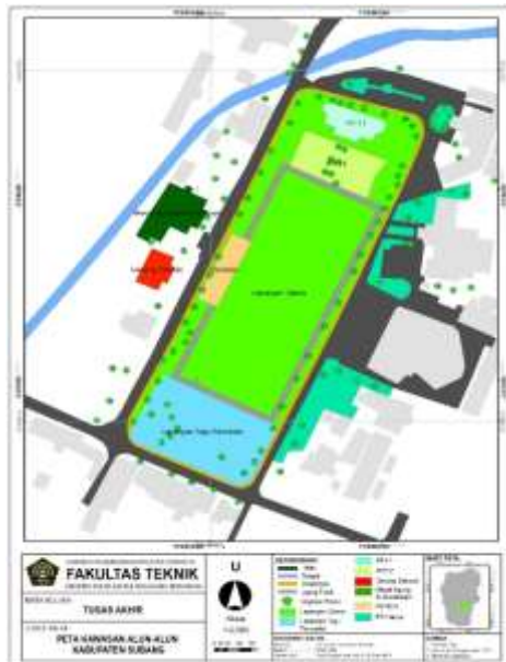
Gambar 2. Peta Alun-Alun Subang

Alun-alun Subang merupakan pusat Pemerintahan Kabupaten, luas lahan kawasan Alun-alun Subang kurang lebih 28.400 m 2 , Adapun aktivitas yang bisa dilihat di area Alun-alun anatar lain: (1) Ruang Aktivitas Olahraga seperti tempat untuk bermain bola, jogging, bola volley, jalan santai, latihan taekwondo, dan juga senam (2) Ruang Aktivitas Sosial seperti mengobrol dengan sesama pengunjung, dengan teman, jalan-jalan santai dan fotografi. (3)Ruang Aktivitas Perekonomian seperti pedagang kaki lima di kawasan Alun-alun Subang. Pada setting ruang kawasan Alun-alun Subang terdapat 9 ruang yang mendukung untuk masyarakat melakukan berbagai aktivitas di Alun-alun Subang seperti Masjid Agung Al-Musabaqoh, Lapangan Utama, Lapangan Tugu Pacasila, Pendopo, RTH 1, RTH 2, Parkir, dan Gedung Dakwah. Selain itu juga terdapat fasilitas umum seperti toilet umum. Lapangan terletak di tengah-tengah kawasan Alun-alun biasanya di pakai untuk berkumpul dan duduk santai.