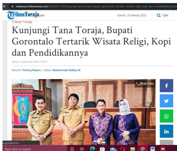
Gambar 5. Salah Satu Pemberitaan online Pariwisata Tana Toraja

Selain media-media online , Dinas Pariwisata Kabupaten Tana Toraja juga tetap memanfaatkan media cetak dalam mempromosikan pariwisata Kabupaten Tana Toraja dimasa pandemi Covid-19. Media cetak sendiri merupakan media penyampaian informasi secara tertulis melalui barang berbahan dasar kertas (Thahira, 2018).