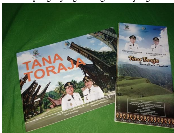
Gambar 6. Booklet dan Brosur pariwisata Kabupaten Tana Toraja

Pemanfaatan media cetak dalam menyampaikan informasi pariwisata di Kabupaten Tana Toraja tetap digunakan dalam masa pandemi Covid-19. Adapun media cetak yang digunakan Dinas Pariwisata Kabupaten Tana Toraja dalam komunikasi pemasaran pariwisata berupa Brosur dan Booklet yang diletakkan pada Bandara Buntu Kunik Tana Toraja, kemudian dibagikan jika tamu atau pengunjung datang berkunjung ke Tana Toraja.