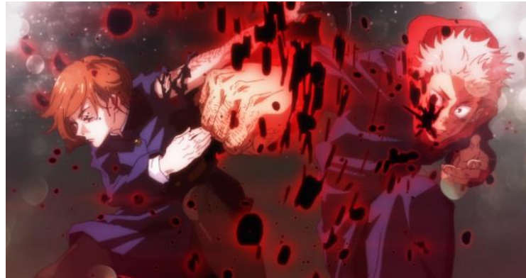
Gambar 6. Nobara Kugisaki dan Yuji Itadori saat bertarung melawan musuh (Sumber: Jujutsu Kaisen , 2020)

Melalui kode aksi, setiap karakter dapat menunjukkan adanya gerakan perjuangan perempuan dalam mengatasi konflik yang terjadi. Maki menunjukkan sikap pertentangan terhadap tradisi keluarganya dan gigih dalam mewujudkan mimpinya tanpa bantuan dari orang lain. Sementara Nobara kerap menunjukkan aksi bahwa perempuan memiliki hak dalam pengambilan keputusan dan melakukan apapun yang ia sukai. Seperti pada Gambar 7, Nobara Kugisaki menunjukkan sikap keterbukaan atas usulan yang ia miliki sehingga ia menyampaikan pendapat dan mengambil keputusan dalam perancangan strategi.