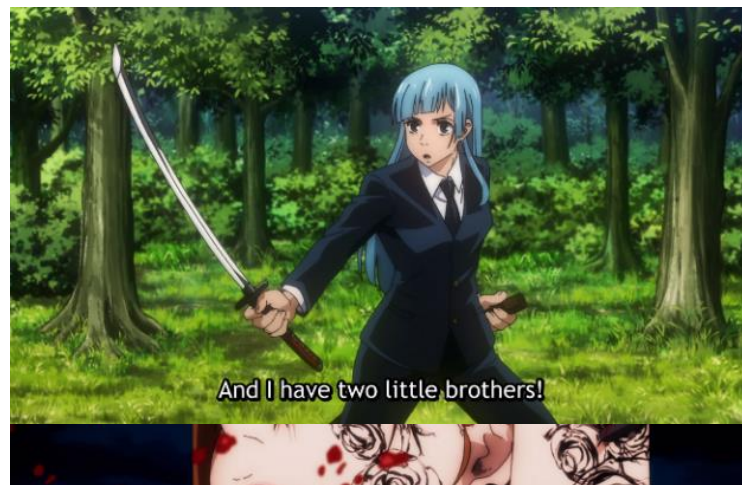
Gambar 3. Penampilan Kasumi Miwa mengenakan pakaian maskulin