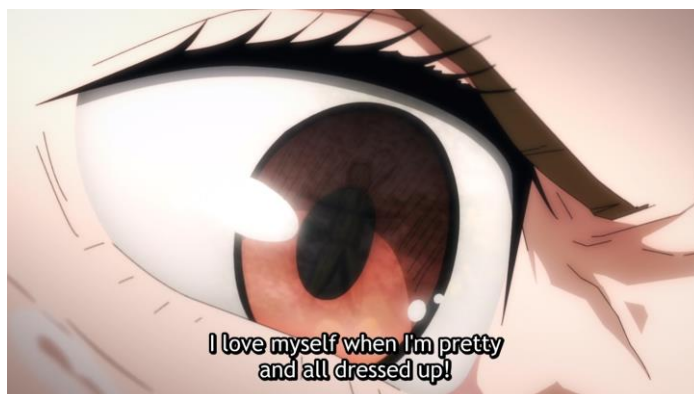
Gambar 5. Nobara Kugisaki saat berhadapan dengan makhluk kutukan (Sumber: Jujutsu Kaisen , 2020)

Teknik long shot digunakan untuk menampilkan keseluruhan objek dan lingkungan di sekitarnya. Teknik ini umum digunakan ketika menunjukkan lingkungan dan suasana pertarungan. Teknik medium shot dan close up digunakan untuk menampilkan ekspresi dan emosi karakter, seperti tertera pada Gambar 5 ketika Nobara menentang pandangan stereotip tentang penampilan perempuan. Dalam adegan lainnya, terdapat penggunaan sudut pengambilan gambar dengan teknik eye level untuk menunjukkan adanya kesetaraan. Sudut low angle digunakan untuk menampilkan keberanian dan kekuatan perempuan dalam pertarungannya melawan musuh.