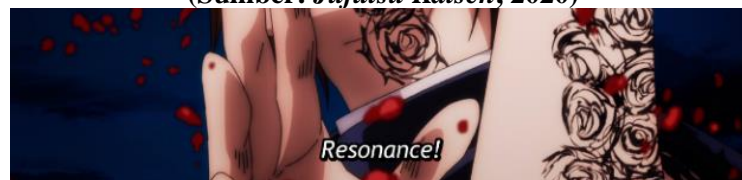
Gambar 4. Nobara Kugisaki dengan tubuh yang terluka (Sumber: Jujutsu Kaisen , 2020)

Kode gestur ditampilkan oleh karakter Nobara Kugisaki yang secara cepat memerintah Yuji untuk memberikan sebagian lengan makhluk terkutuk yang telah terputus. Ia menyerang makhluk tersebut dengan teknik Straw Doll: Resonance yang memanfaatkan beberapa peralatan, seperti paku, palu, dan boneka jerami. Teknik ini memungkinkan Nobara untuk membunuh makhluk kutukan dengan cara meletakkan boneka jerami di bagian tubuh lawan, kemudian melakukan penyerangan dengan menghujamkan paku pada benda tersebut. Kode gestur juga ditunjukkan pada Gambar 4, ketika Nobara ketika bertarung melawan makhluk kutukan dengan tangan yang berlumuran darah.