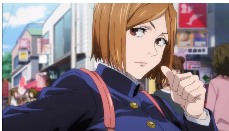
Gambar 1. Penampilan Nobara Kugisaki

Level realitas dalam anime Jujutsu Kaisen dianalisis menggunakan kode-kode realitas yang dianggap mewakili adanya nilai-nilai perjuangan perempuan. Seperti kode penampilan yang ditunjukkan oleh Nobara Kugisaki saat pertama kali ia muncul dalam serial Jujutsu Kaisen . Tokoh Nobara Kugisaki ditampilkan menggunakan busana seragam gakuran yang memiliki ciri khas berkerah tinggi dan berkancing logam (Aditami, 2020) dan dipadukan dengan rok sepanjang lutut. Penampilannya dilengkapi dengan sepasang sepatu berwarna cokelat dan stocking berwarna hitam. Ia juga diperlihatkan membawa sebuah tas ransel berwarna pink dan tas jinjing untuk berbelanja seperti tertera pada Gambar 1.