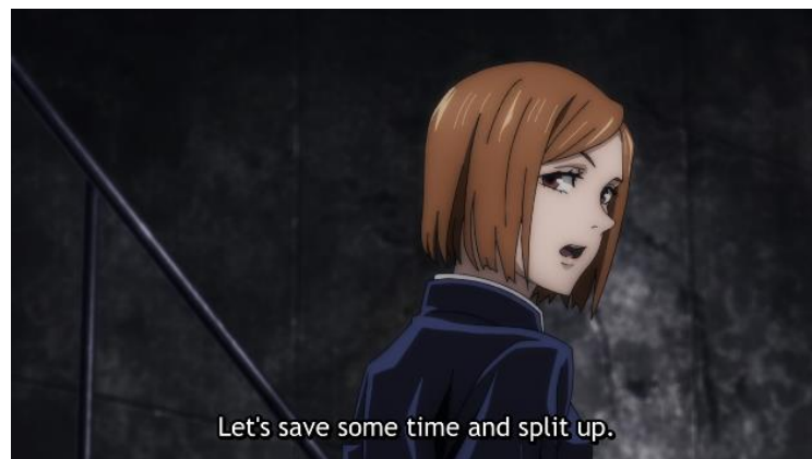
Gambar 7. Nobara Kugisaki dalam pengambilan keputusan

Melalui kode aksi, setiap karakter dapat menunjukkan adanya gerakan perjuangan perempuan dalam mengatasi konflik yang terjadi. Maki menunjukkan sikap pertentangan terhadap tradisi keluarganya dan gigih dalam mewujudkan mimpinya tanpa bantuan dari orang lain. Sementara Nobara kerap menunjukkan aksi bahwa perempuan memiliki hak dalam pengambilan keputusan dan melakukan apapun yang ia sukai. Seperti pada Gambar 7, Nobara Kugisaki menunjukkan sikap keterbukaan atas usulan yang ia miliki sehingga ia menyampaikan pendapat dan mengambil keputusan dalam perancangan strategi.