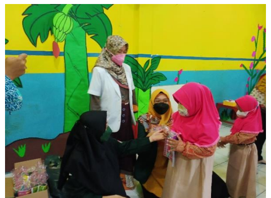
Gambar 9. Pemberian hadiah dan bingkisan kepada anak-anak TK Fajar Rachma