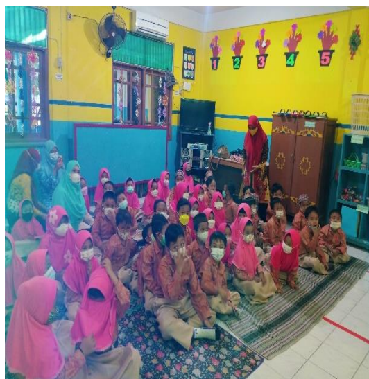
Gambar 4. Persiapan Guru dan Anak-Anak TK Fajar Rachma

Pelaksanaan Kegiatan pengabdian masyarakat berupa penyuluhan Kesehatan gigi kami laksanakan pada hari Kamis 27 Januari 2022. Pelaksanaan berjalan dengan lancar dan semua guru beserta murid TK Fajar Rachma mengikuti kegiatan dengan baik dan antusias