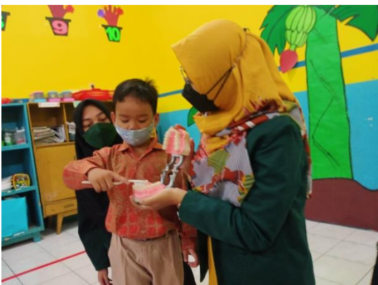
Gambar 6. Peragaan cara menyikat gigi yang baik dan benar