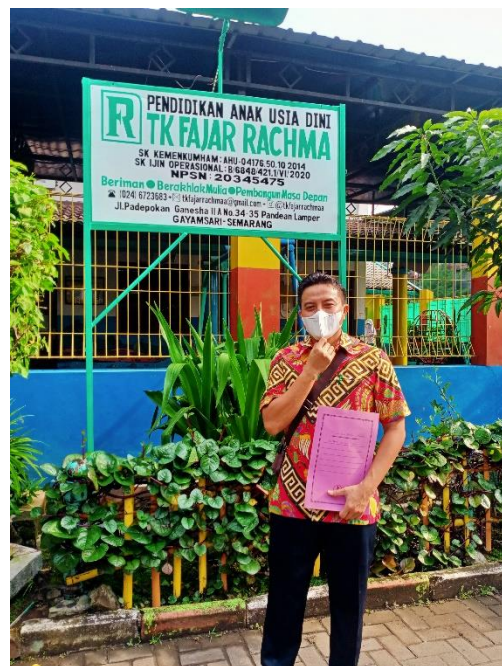
Gambar 1. Proses Survey lokasi TK Fajar Rachma

Kegiatan survei lokasi ini kami laksanakan pada hari rabu 8 Desember 2021. Dalam pelaksanaan Survey lokasi kami mengamati dan menghitung jumlah guru dan anak-anak ddi TK Fajar Rachma yang merupakan sasaran penyuluhan Kesehatan gigi