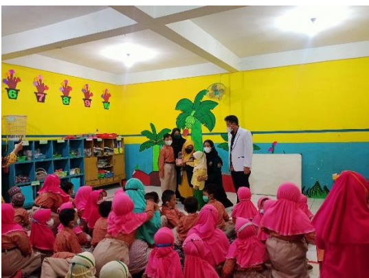
Gambar 7. Role Play cara menyikat gigi yang benar