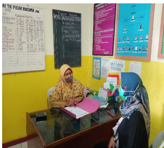
Gambar 2. Proses Perijinan dengan Kepala Sekolah TK Fajar Rachma

Kegiatan perijinan pelaksanaan kegiatan pengabdian masyarakat ini kami laksanakan pada hari Senin 13 Desember 2021. Dalam Kegiatan perijinan ini kami langsung menemui kepala Sekolah TK Fajar Rachma dan kami diberikan ijin untuk bisa melaksanakan kegiatan penyuluhan Kesehatan gigi.