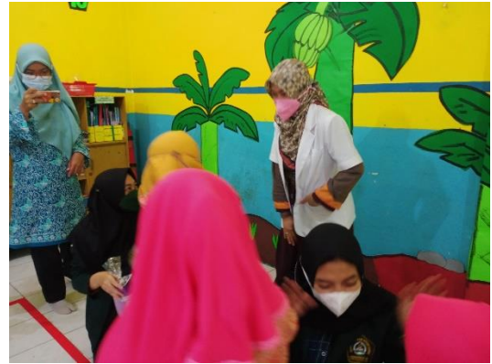
Gambar 8. Pelatihan Guru TK dalam menyikat gigi yang benar