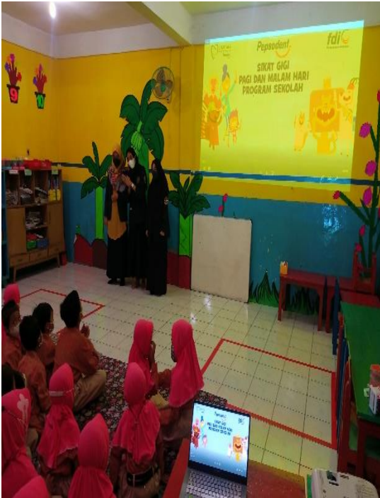
Gambar 5. Pemberian materi tentang Kesehatan Gigi dan mulut