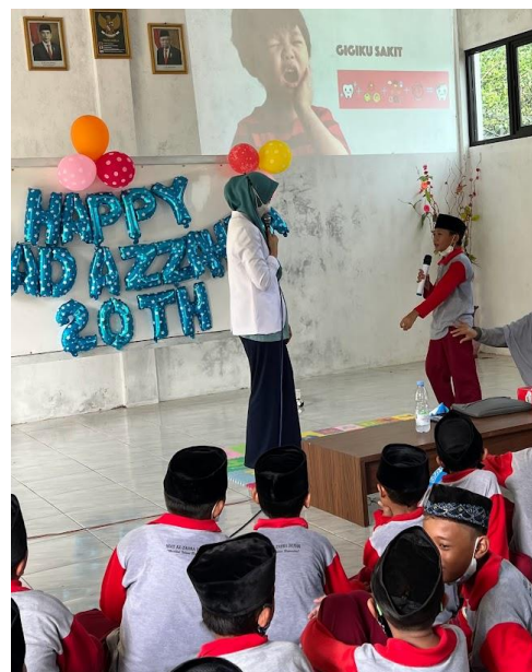
Gambar 4. Kegiatan Penyuluhan Kesehatan Gigi di SD - IT Azzahra Demak