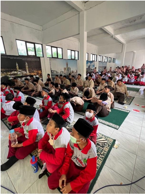
Gambar 5. Peserta Penyuluhan Kesehatan Gigi di SD - IT Azzahra Demak