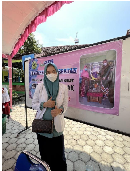
Gambar 3. Persiapan Penyuluhan dan pemeriksaan Kesehatan Gigi di SD - IT Azzahra Demak