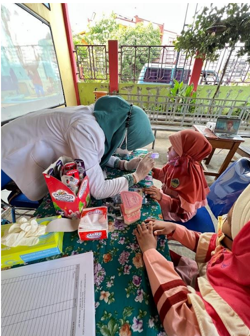
Gambar 6. Kegiatan pemeriksaan Kesehatan Gigi di SD - IT Azzahra Demak