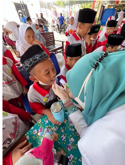
Gambar 7. Kegiatan pemeriksaan Kesehatan Gigi di SD - IT Azzahra Demak