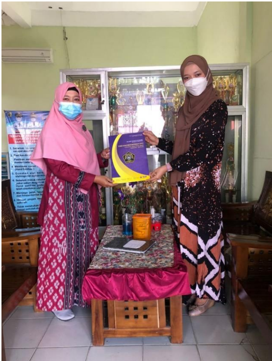
Gambar 1. Proses Perijinan ke SD - IT Azzahra Demak