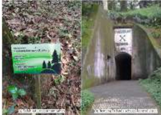
Gambar 7. Dimensi Focal Point Tahura Gunung Kunci

indikator kontrol visual karena ketersediaan bangunan yang menjadi ikon Tahura Gunung Kunci. Gambar 7. Menunjukkan dokumentasi dari ragam tumbuhan dan Benteng Belanda sebagai focal point dari Tahura Gunung Kunci.