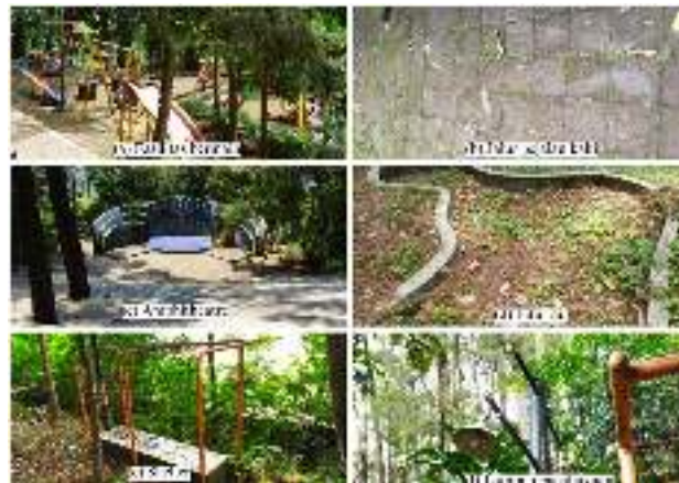
Gambar 5. Dimensi Amenities Tahura Gunung Kunci

Tahura Gunung Kunci memiliki area yang memberikan fungsi pendidikan dan kebudayaan, yakni Benteng Belanda dan berbagai macam flora dan fauna yang ada. Berdasarkan keterangan dari Bapak Wawan Hermawan selaku Kepala Bidang Kehutanan Tahura Gunung Kunci, terdapat program dimana pihak Tahura menginformasikan melalui surat resmi kepada sekolah-sekolah mulai dari TK (Taman Kanak-Kanak) hingga SMP (Sekolah Menengah Pertama) bahwa terdapat Benteng peninggalan yang dapat dikunjungi, dan edukasi tentang alam mengenai tanaman, pohon-pohon, dll melalui data inventaris yang mencatat nama latin dan nama bahasa indonesia bagi flora yang ada. Maka diperoleh skor 3 (tiga) untuk komponen daya tarik pada fungsi edukasi dan budaya. Berikut ditunjukkan dokumentasi dimensi amenities Tahura Gunung Kunci pada Gambar 5.