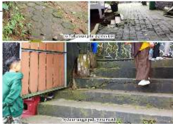
Gambar 6. Dimensi transportation's park and security network

Setelah dilakukan analisis pengukuran pada dimensi transportation's park and security network pada aset di Tahura Gunung Kunci, maka dapat diketahui hasil pengukuran dan ringkasannya sebagai berikut pada Tabel 4.