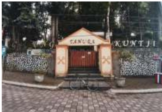
Gambar 1. Tampak Depan Tahura Gunung Kunci

Penelitian ini dilakukan di Ruang Terbuka Hijau (RTH) berupa Taman Hutan Raya (Tahura) Gunung Kunci Sumedang, yang berlokasi di Jalan Raya Bandung – Cirebon, Kelurahan Kotakulon, Kecamatan Sumedang Selatan, Kabupaten Sumedang. Tahura Gunung Kunci telah ditetapkan dan diubah fungsinya dari Kawasan Hutan Produksi Terbatas menjadi Taman Hutan Raya berdasarkan Keputusan Menteri Kehutanan Nomor SK.297/Menhut-II/2004. Kawasan pengelolaan Tahura berdasarkan Keputusan Menteri Kehutanan Republik Indonesia Nomor SK.692/MENHUT-II/2009 tentang Penetapan Taman Hutan Raya Gunung Kunci Seluas 36.686 m 2 , terletak di Kelurahan Kotakulon, Kecamatan Sumedang Selatan, Kabupaten Sumedang, Provinsi Jawa Barat. Tahura Gunung Kunci berada pada ketinggian 485 meter di atas permukaan laut (mdpl). Tampak depan Tahura Gunung Kunci dapat dilihat pada Gambar 1.