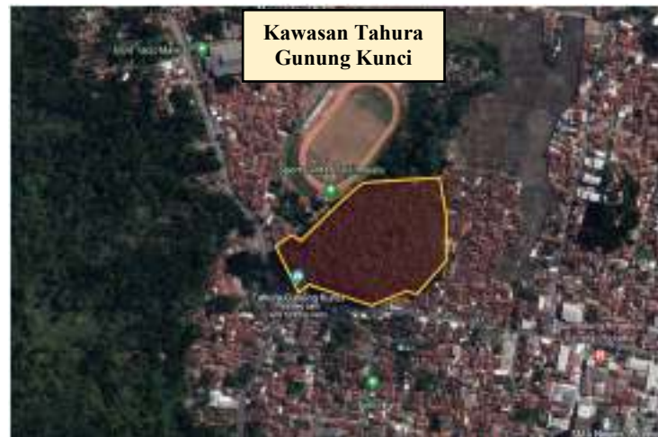
Gambar 4. Peta Lokasi Tahura Gunung Kunci

diketahui bahwa luas lahan Gunung Kunci adalah 36.686 m 2 atau 3,68 hektar. Dikarenakan ukuran area Tahura Gunung Kunci ada pada rentang luas lahan 1-5 ha yang terasuk kategori ukuran area hutan kota yang cukup. Kategori cukup disini berarti luas Tahura Gunung Kunci telah mencapai minimal kriteria luas RTH yaitu 1 ha, dan Tahura Gunung Kunci memadai sebagai RTH Kota dengan area yang cukup luas. Pada Gambar 4. ditunjukkan lokasi Tahura Gunung Kunci.