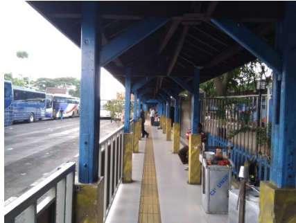
Gambar 3. Jalur Pejalan Kaki di Dalam Terminal Leuwipanjang

Berdasarkan Gambar 3 dapat dilihat jalur pejalan kaki yang berada di terminal Leuwipanjang sudah cukup nyaman namun belum bebas dari hambatan. Hal tersebut dapat dilihat dari pedagang kaki lima yang mangkal di sekitar jalur pejalan kaki.