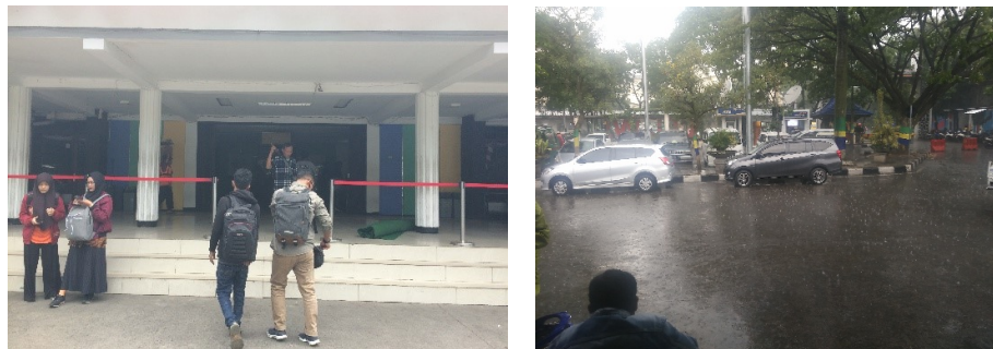
Gambar 6. Area Menurunkan Penumpang di Kawasan Terminal Leuwipanjang

Pada Gambar 6 dapat dilihat area menurunkan penumpang di kawasan Terminal Leuwipanjang. Saat ini area yang disediakan di terminal Leuwipanjang, areanya bersamaan dengan area pejalan kaki.