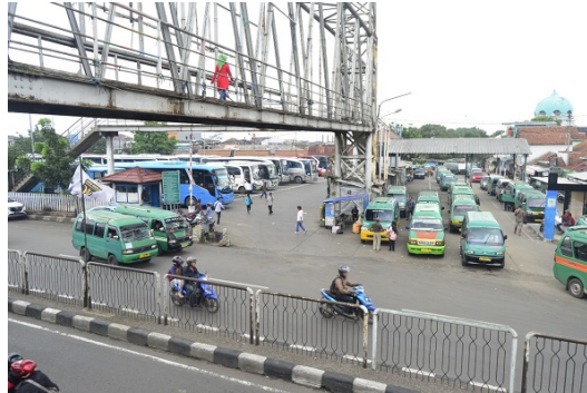
Gambar 8. Jembatan Penyeberangan di Terminal Cicaheum