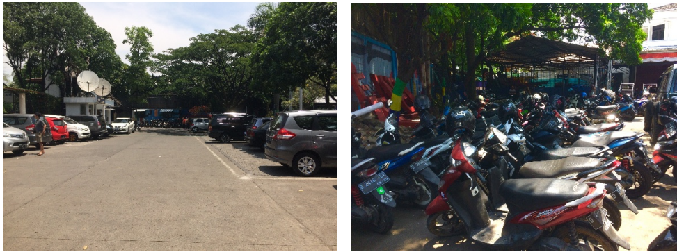
Gambar 5. Parkir Kendaraan Pribadi (Motor dan Mobil) di Terminal Leuwipanjang

Pada Gambar 6 dapat dilihat area menurunkan penumpang di kawasan Terminal Leuwipanjang. Saat ini area yang disediakan di terminal Leuwipanjang, areanya bersamaan dengan area pejalan kaki.