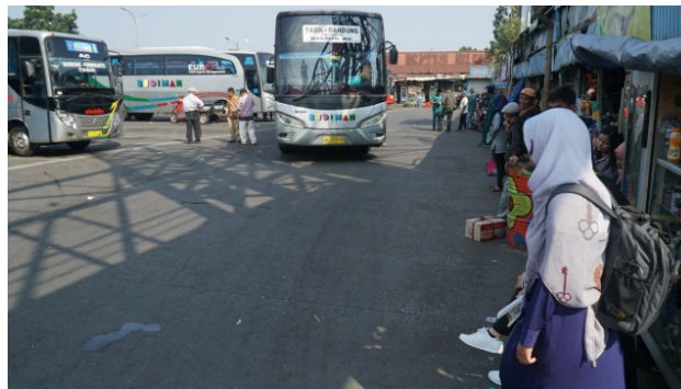
Gambar 7. Ketidaktersediaan Jalur Pejalan Kaki di Terminal Cicaheum

Aktivitas lain yang teridentifikasi di Terminal Cicaheum sebagai terminal tujuan yakni keluar dari Terminal. Berdasarkan aktivitas tersebut dibutuhkan fasilitas jalur pejalan kaki, jembatan penyeberangan, dan halte angkutan umum. Fasilitas bagi pejalan kaki di kawasan terminal Cicaheum belum tersedia, hal tersebut dapat dilihat pada Gambar 7 . Penumpang yang akan naik ke AUP selanjutnya menggunakan bahu jalan yang digunakan AUP. Jalur pejalan kaki di sekitar kawasan tersebut penuh dengan penjual yang membuka kios nya hingga bahu jalan bagi pejalan kaki.