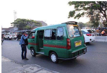
Gambar 4 Penumpang Menggunakan Kendaraan Umum

Berdasarkan Gambar 3 dapat dilihat jalur pejalan kaki yang berada di terminal Leuwipanjang sudah cukup nyaman namun belum bebas dari hambatan. Hal tersebut dapat dilihat dari pedagang kaki lima yang mangkal di sekitar jalur pejalan kaki.