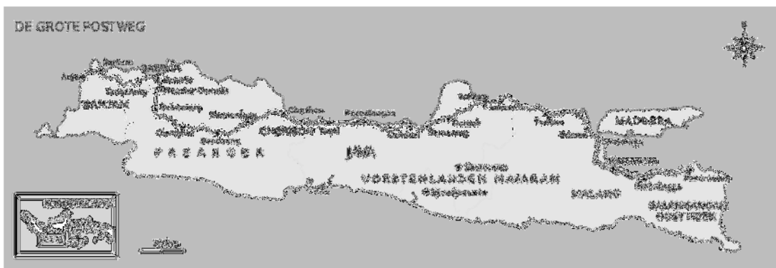
Gambar 2. Peta Jalan Daendels (De Grote PostWeg).

Letak Kecamatan Lasem berada di pesisir pantai utara Jawa Tengah dengan dilintasi Jalan Daendels yang menghubungkan Pulau Jawa bagian barat dengan bagian timur (Periksa Gambar 2). Selain itu, Kecamatan Lasem juga terletak di antara Pelabuhan Jepara dan Pelabuhan Tuban. Hal inilah yang menjadikan Kecamatan Lasem sebagai wilayah yang strategis karena berada di jalur perdagangan darat maupun laut (Utomo, 2009). Letaknya yang strategis menyebabkan Kecamatan Lasem disinggahi banyak pendatang baik dari dalam maupun luar negeri dengan aktivitas perdagangan yang cukup ramai (Utomo, 2009).